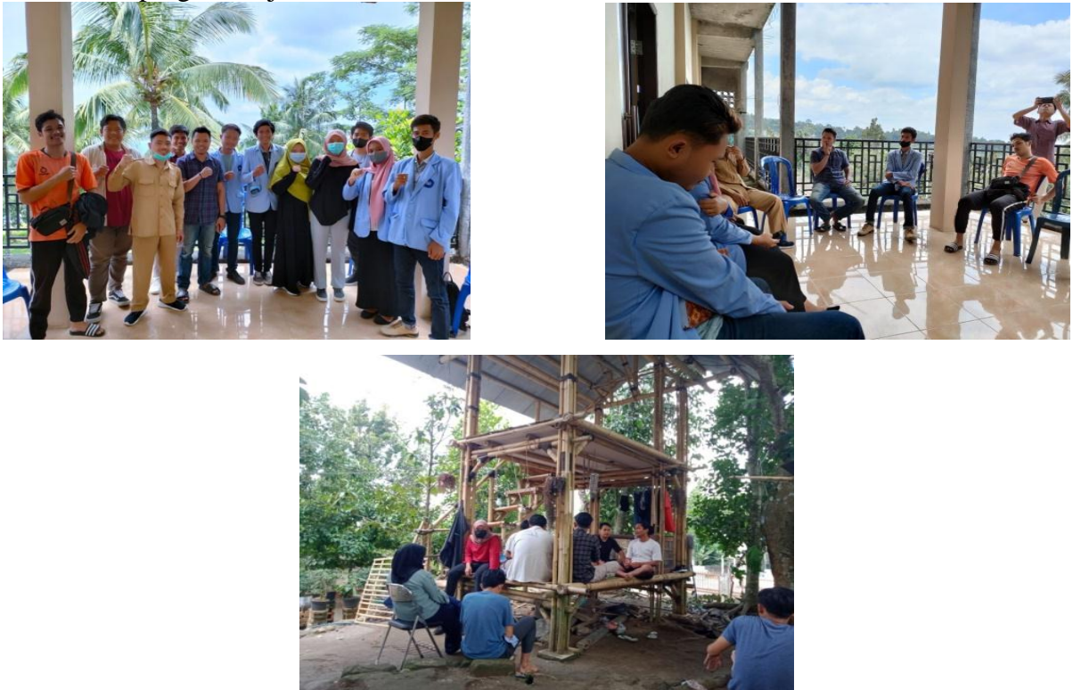
Gambar 1. Sosialisasi dan silaturahmi

Untuk meningkatkan mutu masyarakat desa salah satunya dengan mensosialisasikan potensi-potensi yang ada di Desa Bukit Tinggi yaitu pertama dengan membuat sebuah papan informasi (219adding) sebagai penyebarluasan informasi di desa. Dan kedua memanfaatkan internet dengan membuat akun media 219addin (219adding219m) sebagai penyebarluasan informasi secara online yang bisa diakses oleh siapa saja baik dari masyarakat desa Bukit Tinggi maupun orang luar atau seindonesia sekalipun.