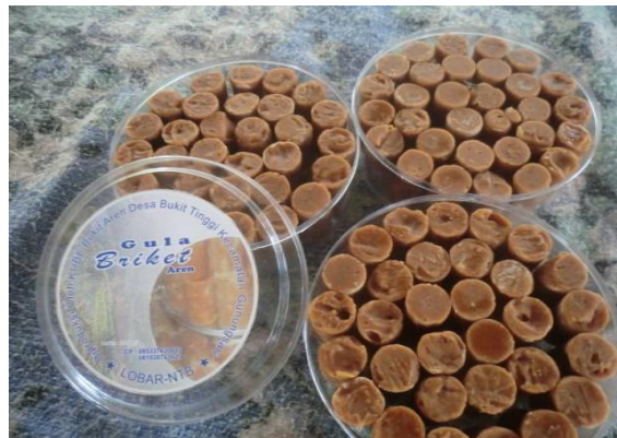
Gambar 3. Proses Pembuatan dan Pengemasan Gula aren

Selain petani, salah satu mata pencaharian masyarakat Bukit Tinggi yaitu membuat gula aren. proses pembuatan gula aren yaitu dari Nira yang diambil dari pohon Enau yang ternyata memiliki banyak manfaat bagi masyarakat Desa Bukit Tinggi. Selain menghasilkan air nira, enau juga memiliki buah yang bisa dikonsumsi yang biasa disebut dengan kolang kaling.