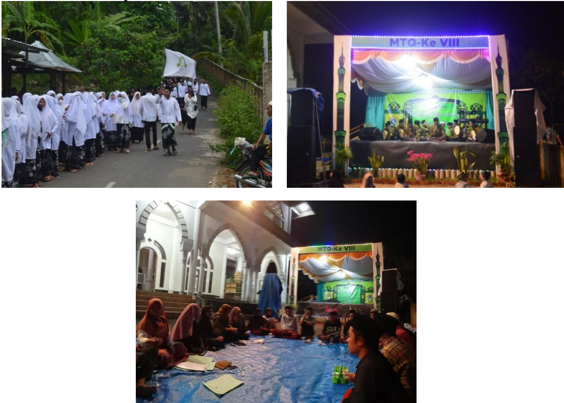
Gambar 4. Kegiatan lomba-lomba menyambut Maulid Nabi Muhammad SAW d. Kegiatan kesehatan serbu vaksin

Kegiatan lomba futsal bagi remaja desa Bukit Tinggi diadakan dalam rangka menyambut hari Maullid Nabi Muhammad SAW. Selain itu, banyak kegiatan lainnya yang dilakukan seperti salat bersama dan ceramah di masjid, jalan santai, lomba adzan, lomba baca surat pendek.