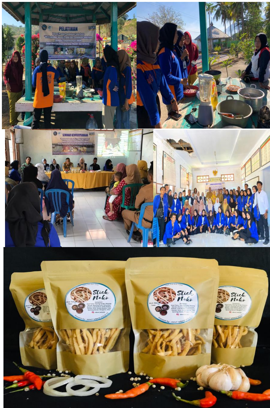
Gambar 2. Foto kegiatan pelatihan

Adapun jumlah peserta pelatihan yang di undang sebanyak 30 orang, akan tetapi yang memenuhi undangan Tim hanya 28 orang. Hal ini di mungkinkan karena adanya kegiatan lain dalam waktu yang bersamaan. Kegiatan pelatihan di laksanakan pada tanggal 12 september 2022 dengan mengambil tempat di kantor kelurahan kolo kecamatan Asakota. Pemilihan tempat ini bertujuan untuk memberikan kemudahan bagi para peserta untuk hadir dalam kegiatan ini. Secara umum semua peserta mengikuti kegiatan dengan baik . hal ini terlihat dari besarnya rasa ingin tahu warga tentang materi